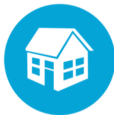
Bouwen, Wonen en Interieur (BWI)