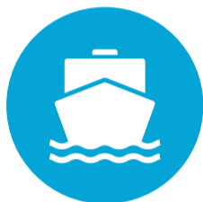
Maritiem en Techniek (MaT)