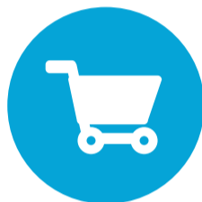
Dienstverlening en Producten (D&P)