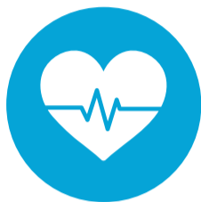
Zorg en Welzijn (Z&W)