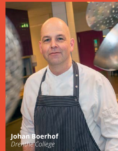
Johan Boerhof Drenthe College

De ambitie is om in september 2023 te starten met doorlopende leerroutes van vmbo basisberoepsgerichte leerweg (bb) naar mbo niveau 2 (Kok en Gastheer/-vrouw); en doorlopende leerroutes van vmbo kaderberoepsgerichte leerweg (kb) naar mbo niveau 3 (zelfstandig werkend Kok en Gastheer/-vrouw). Een ambitieus plan, zeker na een flinke periode van COVID-19, waarin het bieden van de praktijklessen, stages en samenwerking met het bedrijfsleven in de horeca-branche op zijn zachts gezegd een uitdaging was. Van de initiële meerwaarde van versnellen voor de jongere, werd het accent dan ook verlegd naar inhalen, verbreden en verdiepen binnen het onderwijsprogramma.