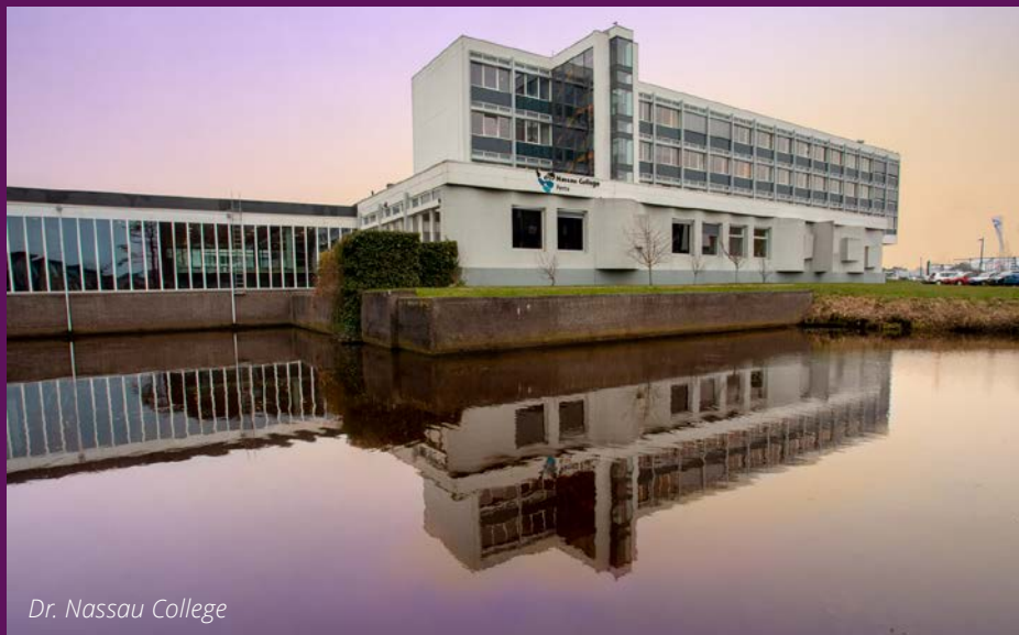
Dr. Nassau College